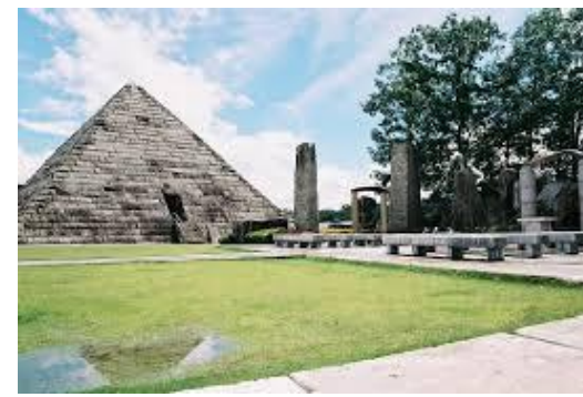
ストーンミュージアム 宝石探し体験