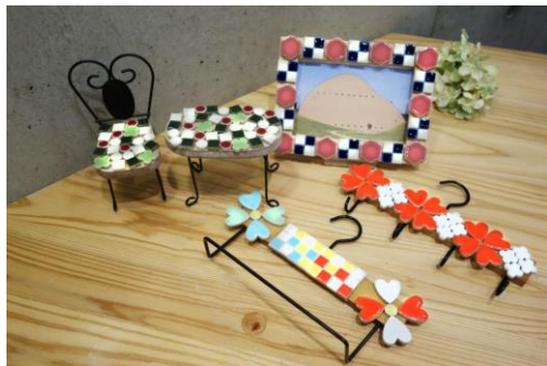
モザイクミュージアムで タイル小物作り