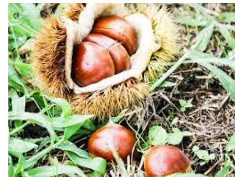
秋の土日限定 栗拾いと栗きんとん絞り