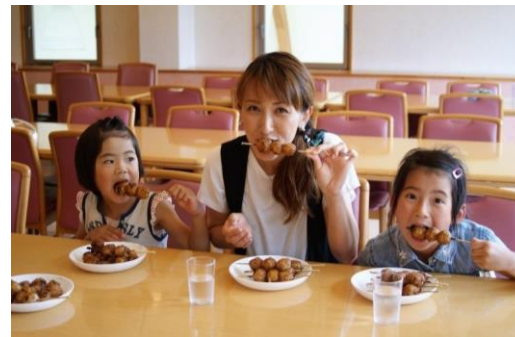
五平餅づくり体験